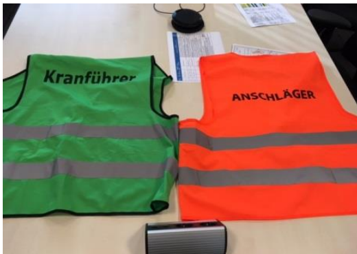
Figuur 1 Veiligheidshesjes kraanmachinist en rigger

Voor -en zo nodig tijdens- de hijswerkzaamheden zal overleg moeten plaatsvinden tussen de machinist, de leidinggevende op het werk en de betrokken werknemers over de planning en veilige uitvoering.